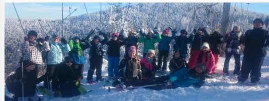
unsere 7. Klassen bei der Skifreizeit