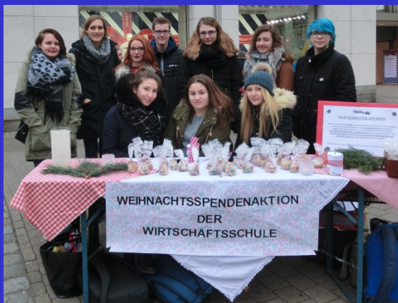
Einige der fleißigen Helfer der 10 G